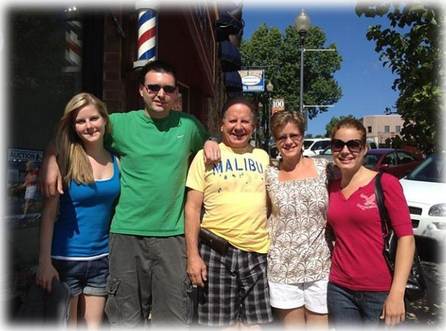
Divertindo com Família