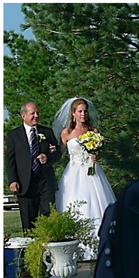
O orgulhoso Pai!