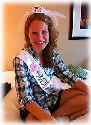
A Radiante Noiva.